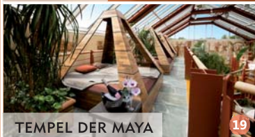
TEMPEL DER MAYA