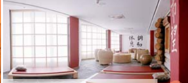
JAPANISCHE ASIA LOUNGE